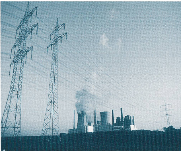
Fig. 2 La libéralisation exige de séparer les comptes des entreprises verticalement intégrées pour les parties production, transport, génération

Dans tous les cas, lorsque cette information est télémesurée, elle va permettre au logiciel de localiser le segment en dé-