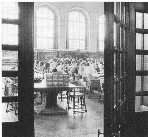
Lesesaal der ETH-Bibliothek in den fünfziger Jahren

In Vitrinen wird der Status des Buches in verschiedenen Epochen aufgezeigt. Dabei geht die Reise von der frühneuzeitlichen Kettenbibliothek über die barocke Saalbibliothek, die Magazinbibliothek und das automatisierte Buchverwaltungssystem zum elektronischen Buch (eBook). Das Buch, anfangs eine örtlich gebundene Rarität, wird im Laufe der Zeit zum logistisch verwalteten Gegenstand und dürfte sich in naher Zukunft als reiner Datenträger mit wählbarem Inhalt