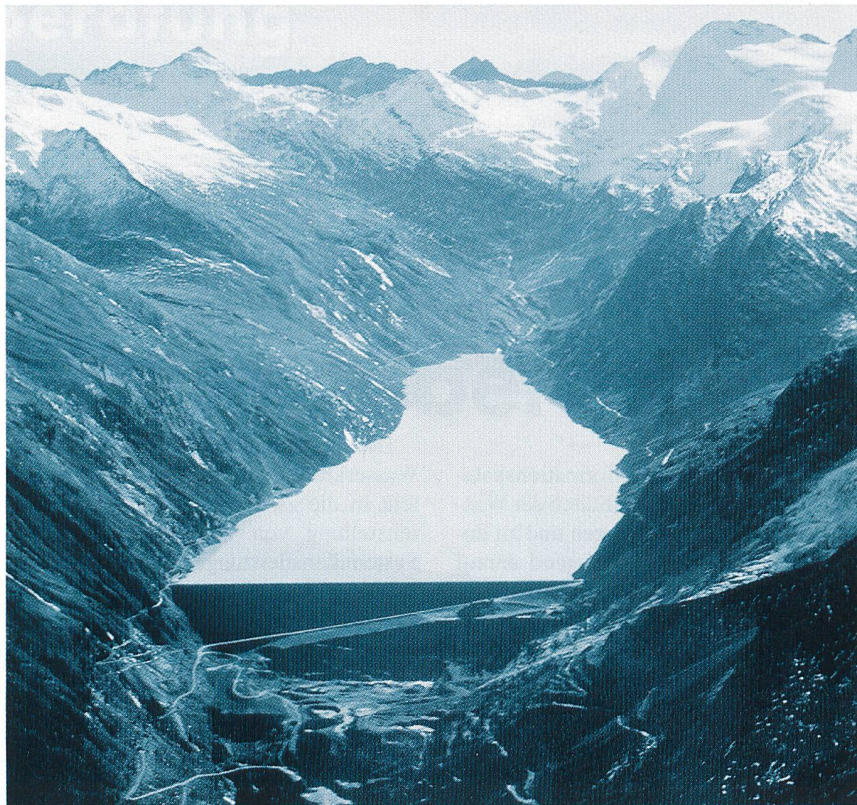
Bild 3 Veredlung der Energieproduktion durch Tages-, Wochen- oder Jahreszeitspeicher (Stausee Mattmark/VS).