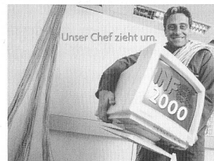
Die Infel hat seit Januar 2000 eine neue Adresse.

(pm) Die Informationsstelle für Elektrizitätsanwendung (Infel) hat neue Räumlichkeiten bezogen. Seit Januar 2000 ist die Organisation in der Militärstrasse 36 in Zürich zu Hause. Die Infel produziert umfangreiche PR- und Kommunikationsdienstleistungen wie auch Verlagsprodukte. Im Zentrum stehen dabei die Kundenzeitschrift Strom in verschiedenen Sprach- und Regionalversionen sowie in zunehmendem Masse individuelle Verlagsdienstleistungen und -produkte für Unternehmen und Organisationen.