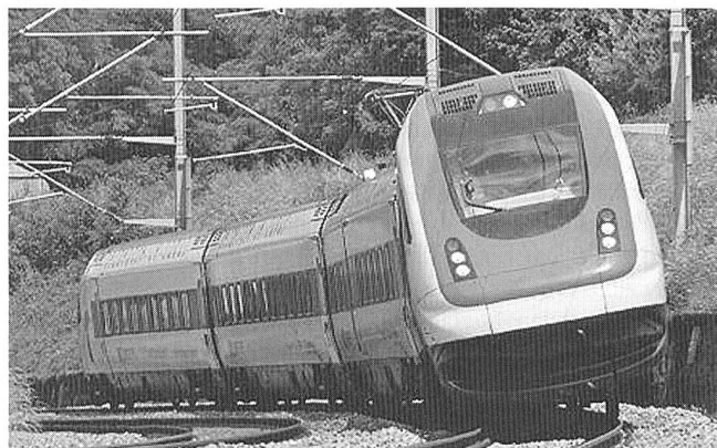
Öffentlicher Verkehr: Technik und Komfort für hohe Passagierzahlen

Bezogen auf die zurückgelegte Distanz pro Einwohner und Jahr liegt die Schweiz mit 1817 km ebenfalls auf dem europäischen Spitzenrang; weltweit führt auch hier Japan mit 1921 km.