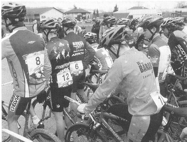
Das Strom-Cup-Rennen ist zugleich Spitzen- und Breitensportanlass.

Am 8. April startete die erste Etappe eines der grössten Events der Strombranche im neuen Millennium: der Strom-Cup. Die alljährlich durchgeführte, von den Elektrizitätsunternehmen gesponserte Rennserie hat den Schweizer Nachwuchs im Mountainbike-Sport entscheidend geprägt. Das moderne Team-Rennen schafft es zudem immer wieder, vor allem auch Anfänger zu begeistern. Für die Elektrizitätswirtschaft ist der Strom-Cup dieses Jahr aktueller denn je, denn auch sie muss sich auf einen Wettbewerb vorbereiten und versuchen, als kleines Team einen internationalen Rang zu erkämpfen.