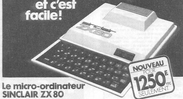
Le micro-ordinateur SINCLAIR ZX 80

Etudes, travail, loisirs : le succès est au programme et c'est facile!