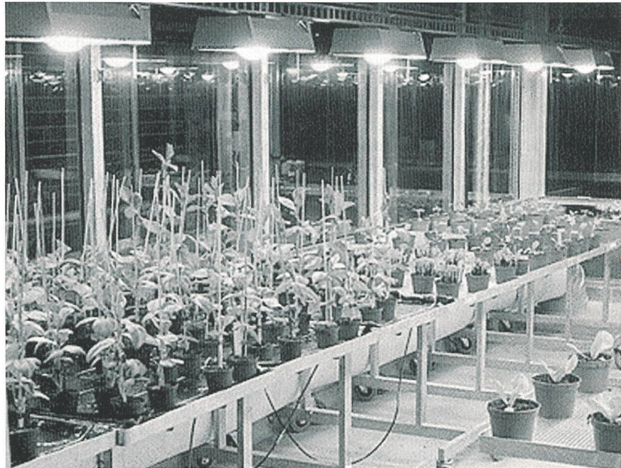
Bild 1 Klimakabinen des Novartis-Forschungszentrums in Stein AG

Novartis Crop Protection, 1996 entstanden aus den Agro-Bereichen der Firmen Ciba und Sandoz, ist im Pflanzenschutz weltweit führend. Im neuen Forschungszentrum in Stein/AG befinden sich auf einer Nutzfläche von 15 000 m 2 Laboranlagen, Klimakabinen, Gewächshäuser und eine Gärtnerei (Bild 1). In den 69 Gewächshauskabinen und 83 begehbaren Klimakabinen müssen verschiedenste Umweltbedingungen simuliert und Versuchsparameter eingestellt werden können.