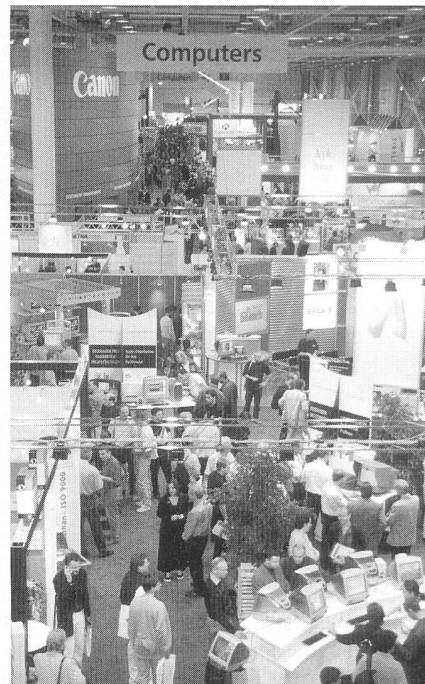
Wegen des geänderten Konzepts werden die Hallen heuer nicht ganz so voll sein wie in den Vorjahren.

Parallel zur Messe findet neu ein hoch stehender Fachkongress statt. Schwerpunkte bilden dabei die Themen Customer Relationship Management, Supply Chain Management und New Markets. Im Nachmittagsprogramm werden in der Praxis erprobte Geschäftsmodelle von