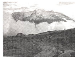
Gelände am Gütsch ob Andermatt.

Kostensenkend wirkt sich aus, dass auf die aufwändigen Windmessungen verzichtet werden kann: 150 Meter neben dem Standort befindet sich eine SMA-Wetterstation. Die Projektplaner müssen die ausführlichen Winddaten nun auf die Nabenhöhe der geplanten Anlage extrapolieren. Eine knifflige Aufgabe stellt sich für den Transport der einteiligen Rotorflügel: Zwar ist der Berg durch eine Militärstrasse erschlossen, doch sind einige Kurvenradien für einen grossen Lastwagen sehr eng. Der Einsatz eines Helikopters wird geprüft.