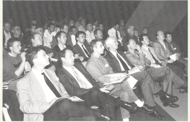
Le public attentif et nombreux de la journée du 17 mai

souci d'offrir à tous ses membres des prestations correspondant aux besoins de chacun a décidé, il y a une année, de prévoir des journées d'information ciblées sur les intérêts des professionnels de la branche