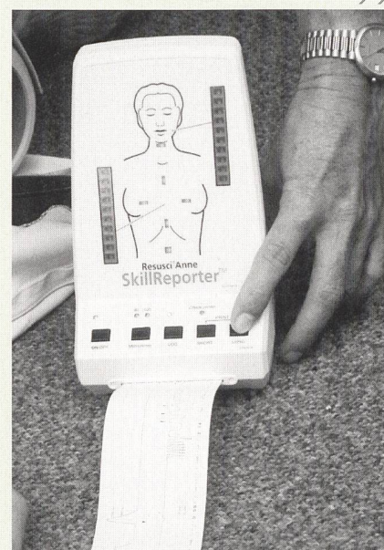
Links: Ruedi Lang demonstriert eine Reanimationspuppe neuester Technik, an welcher ABCD sehr effektiv trainiert werden kann. – Rechts: Der Skill Reporter zeigt laufend an, ob die Manipulation an der Puppe richtig ausgeführt wird, und druckt ein Protokoll aus.