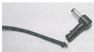
Leicht entflammbare Kabel sollten nicht über den Ladentisch

Wie jeder ordentliche Verlag verfügt auch das Redaktions-Team des «Bulletin» SEV/VSE über eine Digitalkamera. Schnell und unkompliziert lassen sich damit Bilder von Ver-