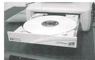
Wer Audio-CD oder DVD für den Eigenbedarf brennt, hat vom Gesetzgeber nichts zu befürchten

Eine Studie der Gesellschaft für Konsumgüterforschung, GfK, hat ergeben, dass beinahe die Hälfte der Befragten Personen im Laufe des letzten Jahres Musikstücke kopiert und an