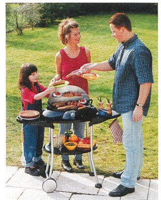
«Konsumentenpolitische Argumentationslinien» zum EMG (Elektrogrill).

Der Stiftungsrat der SKS anerkennt, dass es schwierig ist, die Entwicklungen im Strommarkt vorauszusagen. Diese Entwicklungen werden von den einzelnen Trägerorganisationen der SKS unterschiedlich beurteilt. Der Stiftungsrat der SKS