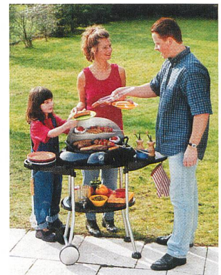
«Konsumentenpolitische Argumentationslinien» zum EMG (Elektrogrill).

Der Stiftungsrat der SKS anerkennt, dass es schwierig ist, die Entwicklungen im Strommarkt vorauszusagen. Diese Entwicklungen werden von den einzelnen Trägerorganisationen der SKS unterschiedlich beurteilt. Der Stiftungsrat der SKS