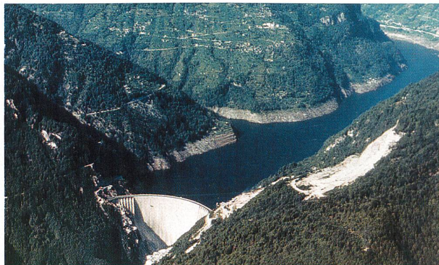
Das EMG soll Randregionen schützen und die Wasserkraft und andere einheimische und erneuerbare Energiequellen fördern.

teiligt zu werden. Das EMG schütze Randregionen, fördere die Wasserkraft und andere einheimische und erneuerbare Energiequellen und setze Leit-