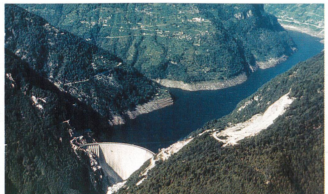
Das EMG soll Randregionen schützen und die Wasserkraft und andere einheimische und erneuerbare Energiequellen fördern.

teiligt zu werden. Das EMG schütze Randregionen, fördere die Wasserkraft und andere einheimische und erneuerbare Energiequellen und setze Leit-