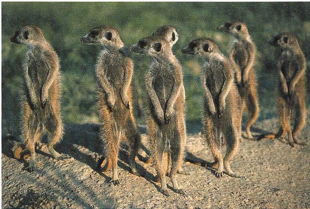
Die Populationsgrösse erlaubt eine ungewöhnliche Arbeitsteilung

Nach der Evolutionstheorie helfen Säugetiere ihren nächsten Verwandten am meisten. Bei Erdmännchen aber gilt Loyalität unabhängig vom Verwandtschaftsgrad: Alle Tiere der Gruppe übernehmen soziale Aufgaben und beteiligen sich an der Nachwuchsbetreuung. Mit diesem Verhalten geben die Tiere Verhaltensforschern eine Reihe von Fragen auf, denn nach der Evolutionslehre bemisst sich der Erfolg eines Individuums an der Zahl seiner Nachkommen. Manche Erdmännchen pflanzen sich aber selber gar nicht fort, sondern widmen ihr Leben ganz oder teilweise der Aufzucht von fremden Jungen.