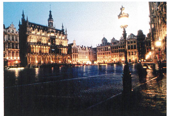
Titelbild Öffnung des Strommarktes in Europa («Grosser Markt» in Brüssel).

ELECTROSUISSE Dienste/Bulletin Luppmenstrasse 1, CH-8320 Fehraltorf Telefon 01 956 11 21, Fax 01 956 11 22