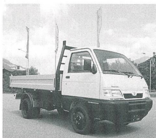
Piaggio Porter Maxxi 4x2 oder 4x4 mit Doppelbereifung und einer Nutzlast bis 1,2 t

Docar AG Nutzfahrzeuge, Chur, Telefon 081 258 66 67, www.docar.ch oder bei jedem Piaggio-Porter-Vertreter.