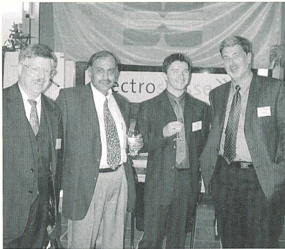
Die 225 Teilnehmer kamen aus allen Teilen der Welt