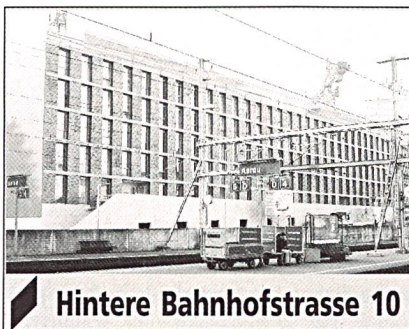
Hintere Bahnhofstrasse 10