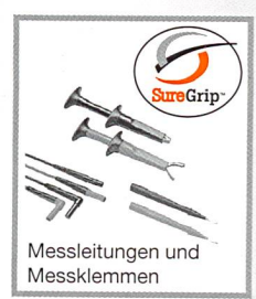
Messleitungen und Messklemmen