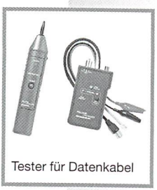
Tester für Datenkabel