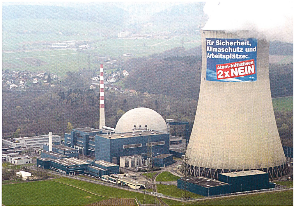
Diesmal drehte die sonst als nüchtern geltende Strombranche den Spiess um. Nicht Greenpeace hängte Plakate an den Kühlturm, sondern wir. Mit einem Riesenplakat am Kühlturm des Kernkraftwerks Gösgen informierte die Branche über die Bedeutung der Kernenergie und die Schädlichkeit der Initiativen.

Vor allem darin unterschied sich der Charakter dieses Abstimmungskampfes von bisherigen Kampagnen der Branche. Das persönliche Engagement war diesmal gross und die Zusammenarbeit untereinander und mit anderen Organisationen funktionierte. Noch ein halbes Jahr zuvor, bei der EMG-Abstimmung, war die Branche und ihre Exponenten im Abstimmungskampf sehr zurückhaltend, gespalten und teilweise alleine. Doch dies-