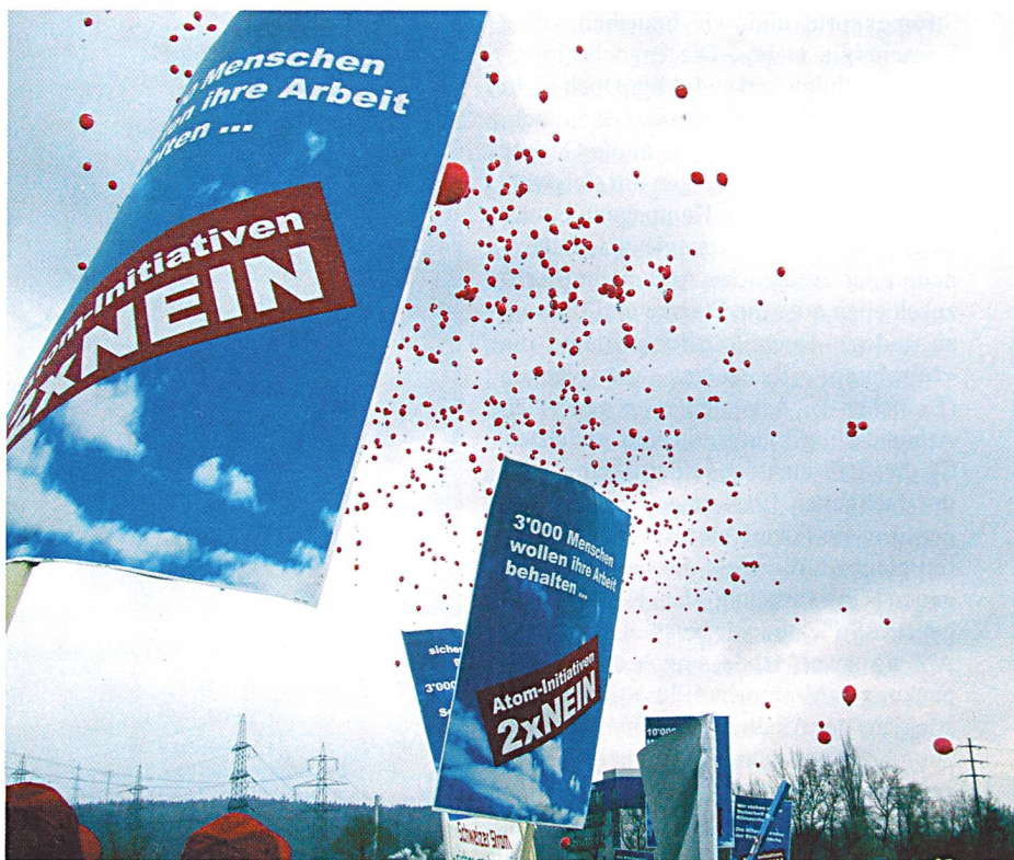
Am nationalen Aktionstag vom 12. April 2003 demonstrierten über 4000 Personen gegen die beiden Ausstiegsinitiativen. Mit selbst gebauten Transparenten und Fahnen zogen sie durch die Städte Aarau, Bern, Luzern, Olten und Zürich. Die anschliessende zentrale Grossveranstaltung fand beim Kernkraftwerk Gösigen statt. Für viele war es die erste Teilnahme an einer Demonstration. Die Kundgebung war ein klares, eindrückliches und glaubwürdiges Votum gegen den Atomausstieg.

Ohne euphorisch zu sein – es gab auch einige Schwierigkeiten – ist der Einsatz der Branche im Abstimmungskampf positiv zu würdigen. Die Branche hat für ihre Anliegen gekämpft und die Ableh-