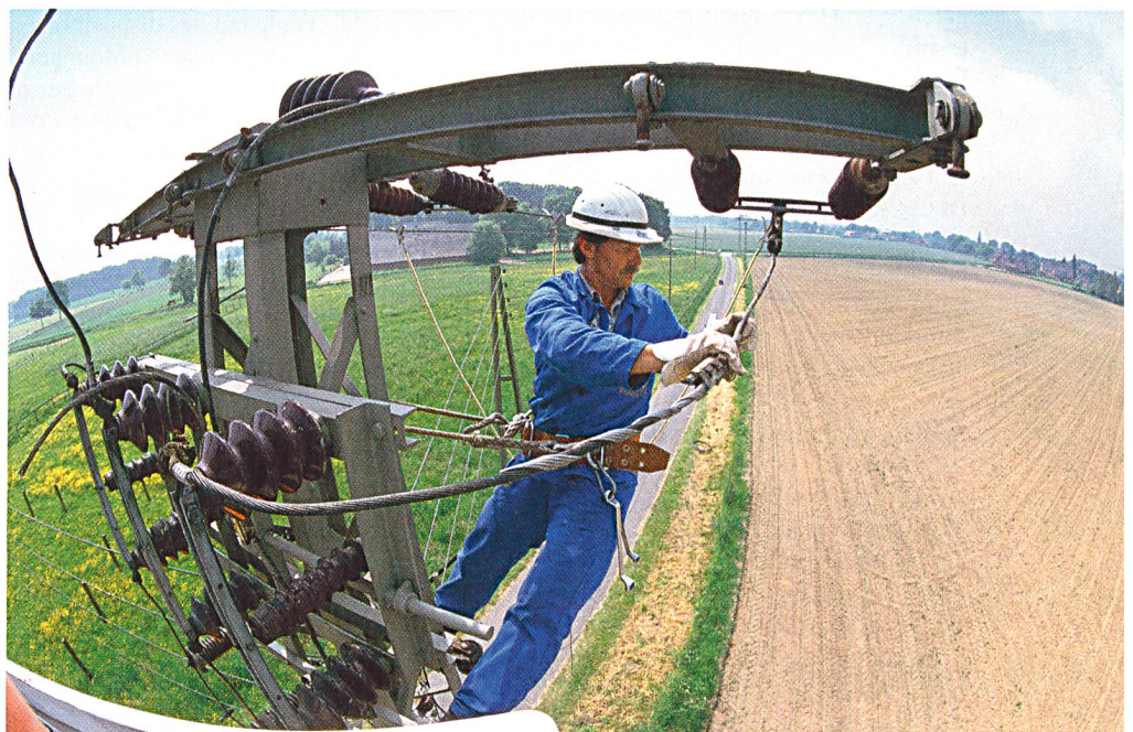
Namentlich gelernte und hoch qualifizierte Berufsleute mit technischen und handwerklichen Berufen sind vielseitig einsetzbar (Photo RWE).

Die Autoren der Studie rechnen unter den gegebenen Rahmenbedingung mit einer ähnlichen Entwicklung in den kommenden Jahren: Insgesamt erwarten sie einen kurz- bis mittelfristigen Stellenabbau von 200 bis 400 Stellen pro Jahr.