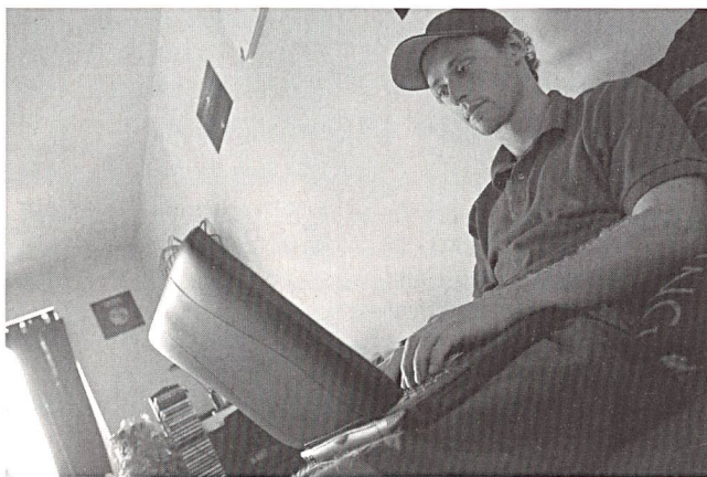
Die ersten 6 Monate Betrieb von www.tschau.ch zeigen: Jugendliche nutzen rege die individuelle Internet-Beratung.

Über die Hälfte der Fragesteller kam aus den Kantonen Aargau (rund 110), Zürich (rund 100) und Bern (rund 80), wobei beinahe zwei Drittel weiblichen Geschlechts waren. Der Schwerpunkt der Fragen betraf die Sexualität (40%) und Beziehungsprobleme (25%). Nur gerade 4% der Fragen drehten sich um das Thema Schule. – Quelle: www.tschau.ch