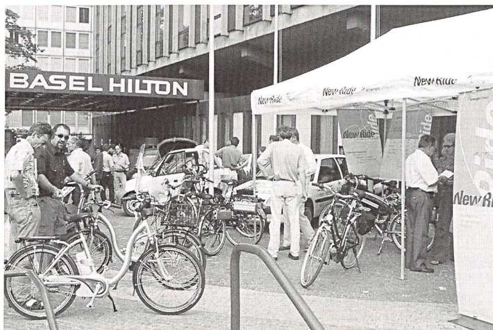
Vor allem die neuen Elektro-Velos fanden an der Ausstellung vor dem Hotel Hilton in Basel reges Interesse.