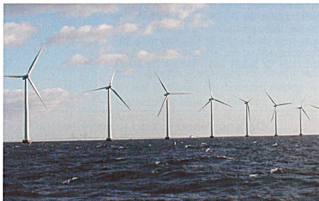
Empfindlich vom Windangebot abhängig: Windanlagen in der Ostsee

Kohlekraftwerken entspricht. Während allerdings Steinkohlekraftwerke während rund 4700 Volllaststunden betrieben werden (Braunkohle-Kraftwerke sogar mit 7100 Stunden), bringen es Windkraftanlagen auf Grund der schwankenden Windangebote auf lediglich 2000 Volllaststunden. – Quelle: VDE