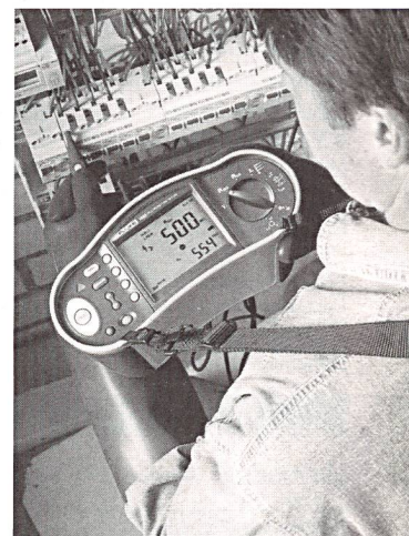
Einfache und schnelle Prüfung von Installationen nach NIV und IEC 60364 mit den neuen Testern Fluke Serie 1650.

Die Reihe der neuen NIV-Tester umfasst drei Modelle: Fluke 1651 misst die Auslösezeiten von Fehlerstrom-Schutzeinrichtungen. Das Modell 1652 bietet zudem Messungen für Fehlerstrom-Schutzeinrichtungen, während 1653 auch Messungen des Erdungswiderstands und der Drehfeldrichtung ausführen kann. Zusätzlich bietet das Spitzenmodell einen internen Speicher für bis zu 500