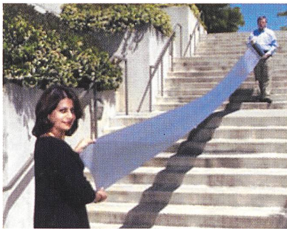
Elektronisches Papier lässt sich in beliebiger Länge produzieren

Logic ist die ETHZ selber am Patent des neuen Magnus-Salzes beteiligt.