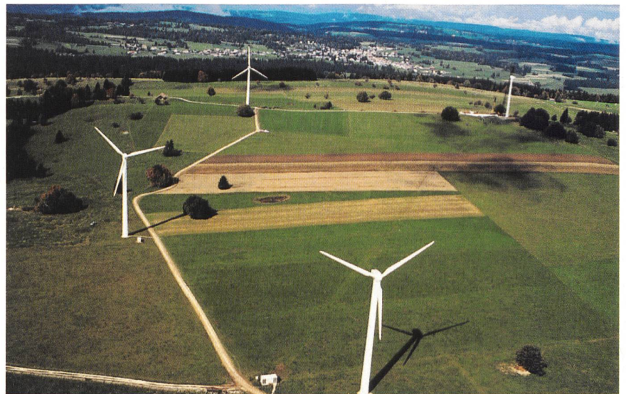
Die auf 1240 m ü.d.M. gelegene Anlage auf dem Mont Crosin erzeugte im Jahr 2003 rund 4,4 GWh elektrische Energie

zierte Energieproduktion.