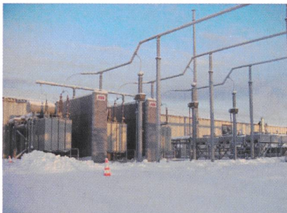
Batteriespeichersystem BESS (Battery Energy Storage System). Ansicht der Transformatoren: links die 138-kV-Zuleitung, rechts die Wärmetauscher der Kühlanlage. Die Abwärme des Stromrichters wird an die Umgebung abgegeben.

Die Stromausfälle der letzten Monate in den USA und in Europa sind in grossen Verbundnetzen in der Regel eine Seltenheit, da sie üblicherweise den Ausfall eines Kraftwerks oder den Unterbruch einer Übertragungsleitung verkräften. In lokalen Netzen, welche abgelegene oder dünn besiedelte Regionen versorgen, kann schon der Ausfall eines Kraftwerks oder das Zuschalten eines Grossverbrauchers zu erheblichen