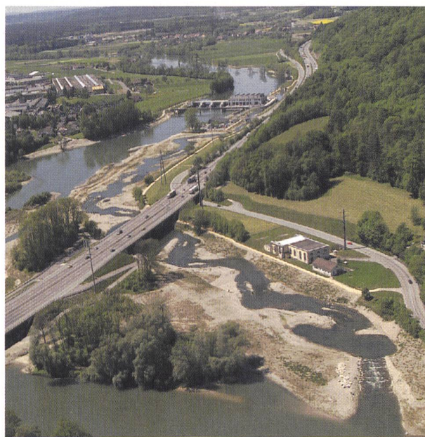
Das Bild zeigt die Situation in Ruppoldingen aus der Luft im Mai 2002. Besonders gut erkennbar ist das Umgehungs-gewässer.

Das Umweltmonitoring im Bereich des Kraftwerkes Ruppoldingen wird in den nächsten Jahren weitergeführt.