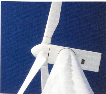
Windenergie deckt bereits 4% des Strombedarfs Deutschlands ab

Nach Angaben des Bundesverbandes Windenergie gingen im letzten Jahr Windkraftanlagen mit 2500 MW Leistung ans Netz, 2002 betrug der Zubau noch 3247 MW. Zudem musste die Branche das dritte windchwache Jahr in Folge verkraften. Der Wind blies 2003 durchschnittlich 20% weniger als im Jahresmittel seit Beginn der Erfassung 1989. Windintensive Standorte mussten bis zu 11% Ertragseinbußen hinnehmen, windschwächere Standorte sogar bis zu 28%.