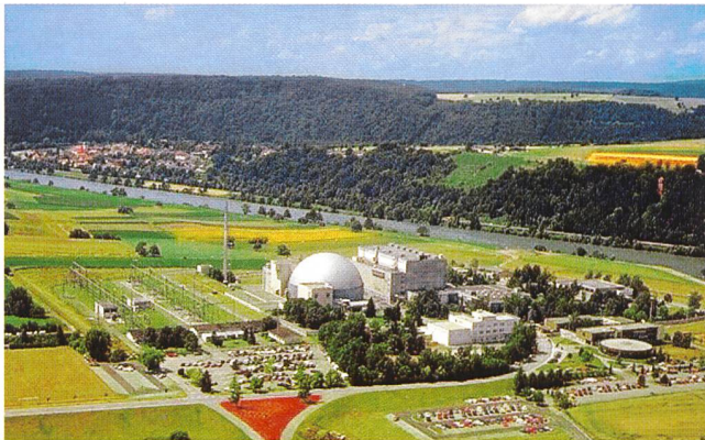
Sitz der EnKK wird das Kernkraftwerk Obrigheim.