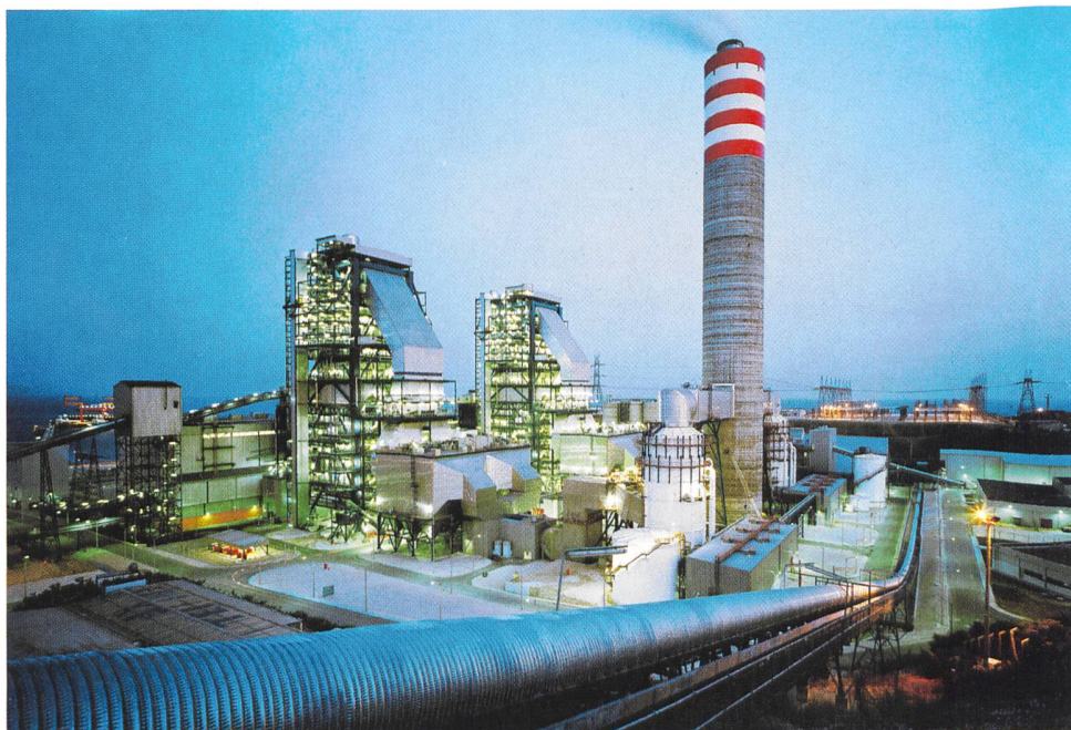
Knapp 3,3 Mio. Tonnen Steinkohle werden in Iskenderun jährlich verstromt, bei Volllast verbraucht das Kraftwerk bis zu 10 000 Tonnen täglich. Das Kraftwerk kann bis zu 8% des Bedarfs an elektrischer Energie in der Türkei abdecken.

Die grösste deutsche Investition in der Türkei soll den chronischen Strommangel in der Region von Adana beheben. Rund zwei Millionen Menschen leben in der Metropole. Die Hauptstadt der gleichnamigen