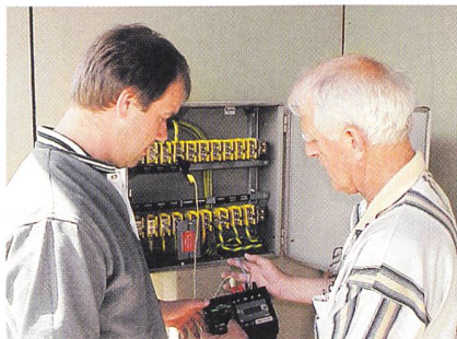
Praktische Übungen vertiefen die theoretischen Ausführungen.

Die Richtlinien «Kontrolle von öffentlichen Beleuchtungsanlagen» (STI Nr. 244.1202 d) sind seit Dezember 2002 gül-