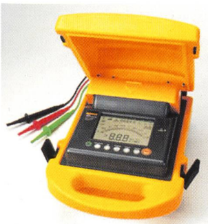
Neuer 5-kV-Isolationstester 1550B von Fluke

Die Prüfspannungen von 250 V bis 1000 V sind in Schritten von 50 Volt einstellbar und von 1000 bis 5000 V in Schritten von 100 V. Das Gerät berechnet automatisch die dielektrische Absorption und den Polarisationsindex, weist eine verbesserte Rampenfunktion (0 bis 5000 V DC) für Ausfalltests auf und bietet 99 Speicherplätze für alle Messparameter, denen zum einfachen Abrufen jeweils eindeutige, benutzerdefinierte alphanumerische Bezeichnungen zugewiesen werden können. Isolationswiderstände bis 1 Teraohm können mit den fünf Prüfspannungen 250 V, 500 V, 1000 V, 2500 V und 5000 V gemessen werden. Wenn das Gerät an einen spannungsführenden Stromkreis angeschlossen