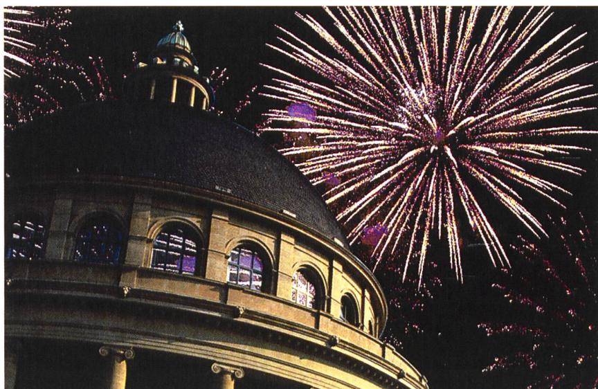
2005 ist für die ETH-Angehörigen wie für die Schweizer Bevölkerung ein besonderes Jahr: Zum 150-Jahr-Jubiläum wird sich die Hochschule mit vielen Aktivitäten als Teil der Gesellschaft darstellen.