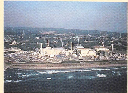
Kernkraftwerk Hamaoka an Japans Südküste.

(sva) Nach einer Bauzeit von fünf Jahren hat das japanische Kernkraftwerk Hamaoka-5 im März 2004 den nuklearen Probebetrieb aufgenommen. Die Anlage mit fortgeschrittenem Siedewasserreaktor ist die dritte ihrer Art in Japan und hat 1325 MW Leistung. Sie steht an Japans Südküste rund 200 km südwestlich von Tokio und wird von Chubu Electric Power betrieben.