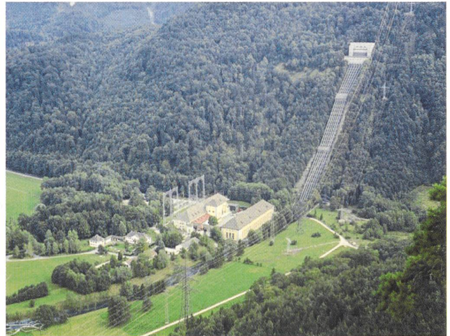
Bayern ist das deutsche Bundesland mit dem höchsten Wasserkraftanteil (Pumpspeicher-Kraftwerk Walchensee).

Den anderen erneuerbaren Energien gegenüber weist die Wasserkraft erhebliche energiewirtschaftliche Vorteile auf. Dennoch ist der Erhalt der Wasserkraft in Bayern gefähr-