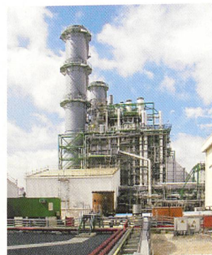
720-MW-GUD-Anlage Phu My 3.

(si) Die GUD-Anlage Phu My 3, etwa 70 Kilometer südöstlich von Ho Chi Minh Stadt, leistet einen massgeblichen Beitrag zur Linderung des Strommangels in Vietnam. Das grösste privat betriebene Kraftwerk Vietnams hat Siemens Power Generation kürzlich schlüsselfertig errichtet. Das Kraftwerk wird mit lokalem Erdgas aus zwei neu erschlossenen Off-Shore-Gasfeldern befeuert. Zum Lieferumfang gehören zwei Gasturbinen mit entsprechenden Hilfsaggregaten, eine Dampfturbine, drei Generatoren sowie ein Wartungsvertrag mit einer Laufzeit von zwölf Jahren. Rund 720 Megawatt speist Phu My 3 in das Netz des staatlichen Energieversorgers Electricity of Vietnam ein.