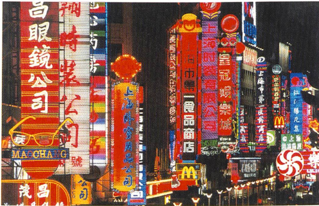
Stromnachfrage steigt schneller als das Angebot (Beleuchtung in Shanghai).

(m/gS) Die Stromknappheit in China wird immer mehr zum allgemeinen Problem. Die Nachfrage wuchs in den vergangenen Jahren zweistellig und inzwischen wird es in manchen Regionen des Landes ziemlich eng mit der Versorgung von Strom.