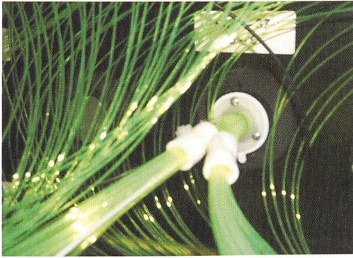
Unbundling kostet viel Geld.

ab 1. Juli 2004 einen diskriminierungsfreien Netzzugang für alle Anbieter gewährleisten. Das Problem: Bisher waren Netz und Vertrieb in einem einzelnen Unternehmen stark integriert. Durch das Unbundling – bis hin zur gesellschaftsrechtlichen Entflechtung fallen für Stadtwerke und Regionalversorger einmalige Mehrkosten von bis zu zehn Millionen Euro pro Unternehmen sowie zusätzliche laufende jährliche Kosten in durchschnittlich sechsstelliger Grösse an. Die Zusatzkosten für die Energiekonzerne sind noch erheblich höher. Ursache für die zusätzlichen Kosten sind die Folgen der Trennung von Netz und Vertrieb. Dazu müssen beispielsweise Unternehmenstochter für Netzbetrieb und Vertrieb gegründet werden. Kosten sparende Synergieeffekte entfallen.