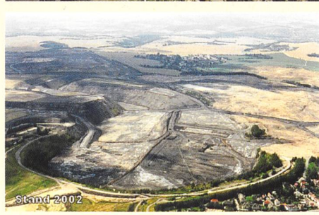
Verfüllung des Uranerzbergbaubaus Lichtenberg/Thüringen, Stand 1991 und 2002.

auf von der Internationalen Kommission zum Schutz vor nichtionisierender Strahlung erarbeitete Empfehlungen (IC-NIRP) stützt. Die Mitgliedstaaten haben nun vier Jahre Zeit, um die Richtlinie ins nationale Recht umzusetzen.