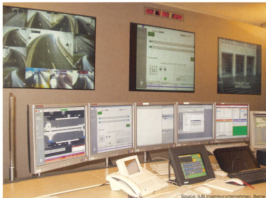
Figure 1 Vue des écrans avec tronçon de tunnel

Le réseau de communication doit d'une part permettre la gestion vidéo tout en pouvant recevoir les instructions de commutation Codec 7) du système de contrôle-commande et des installations techniques du tunnel, et d'autre part transmettre les messages sur l'état technique des installations et l'exécution des instructions de commutation vers le système supérieur de contrôle-commande. Pour cela, il faut prévoir des interfaces performantes appropriées.