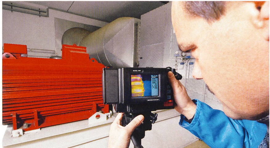
Vorbeugende Instandhaltung: Lager-Diagnose an elektrischem Antrieb.

Die Thermografie erfüllt in der Industrie einen ähnlichen Zweck. Hier gelangt