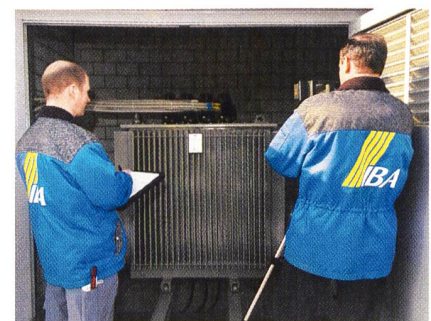
Alles O.K.?: Kontrolle der Stromanschlüsse an einem Verteiltransformator.

Der Kostenaufwand für thermografische Prüfungen steht in keinem Verhältnis zu den Kosten, die bei einem Schaden- oder gar Brandfall entstehen können, und ist in der Regel rasch amortisiert. Der hohe technische Nutzwert generiert darüber hinaus vielfach auch gezieltes Einsparpotenzial.