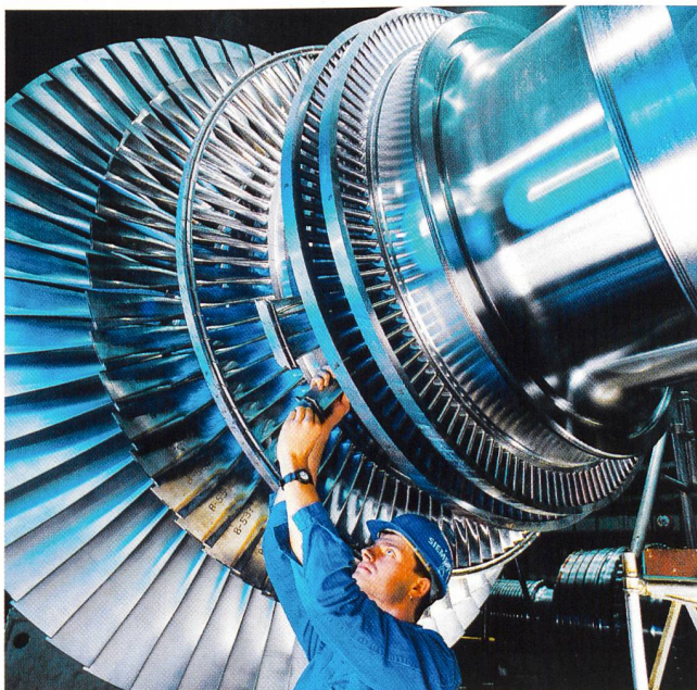
Wartung einer Kraftwerksanlage (Dampfturbinenrotor).

(e) Die Fiat SpA will ihren Anteil von 24% an der ItalEnergia verkaufen. Das Unternehmen kontrolliert die Edison SpA, Mailand. ItalEnergia werde mittel- bis langfristig nicht