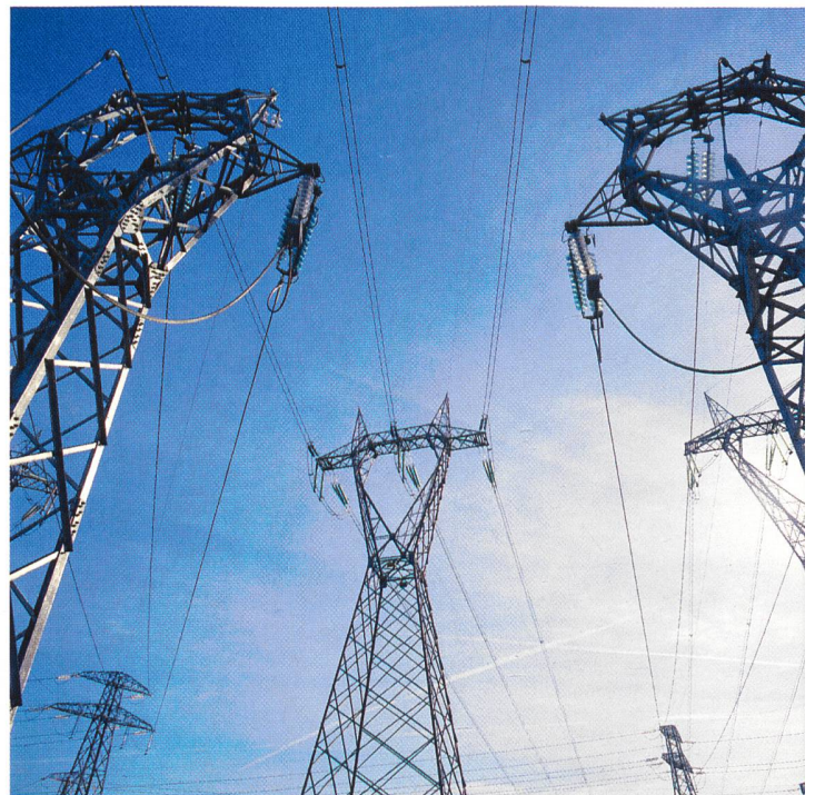
Weitere Anteile von ENEL stehen bald zum Verkauf.

(e) Die italienische Regierung wird nach Erwartung von Branchenbeobachtern vor Jahresende einen Anteil an der Ente Nazionale Energia Elettrica SpA (ENEL) zum Schuldenabbau veräussern. Der 61%-Regierungsanteil ist gegenwärtig rund 24 Mrd. Euro wert. Es sei damit zu rechnen, dass die Regierung mindestens 10% vor Ablauf des Jahres verkauft. Das Wirtschaftsministerium hält einen direkten Anteil von 51% an ENEL und weitere 10% indirekt über die staatliche Cassa Depositi e Prestiti. Im Rahmen der wirtschaftlichen Richtlinien bis 2008, welche die Regierung Anfang August gebilligt hatte, hat sich der Staat das Ziel gesetzt, Privatisierungen im Wert von insgesamt 25 Mrd. Euro durchzuführen.