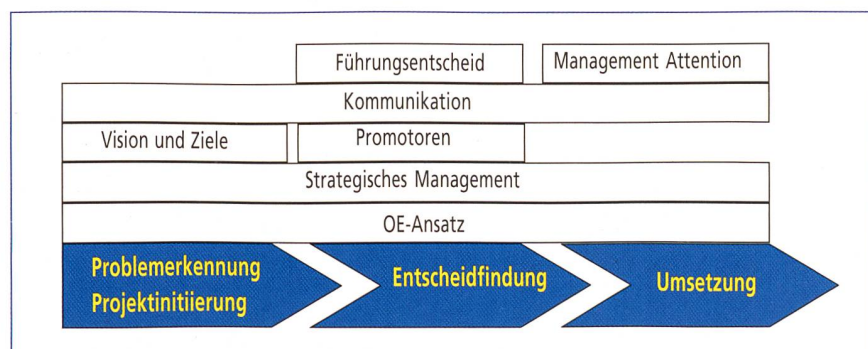
Bild 1 Handlungsempfehlungen für den Zusammenschlussprozess.