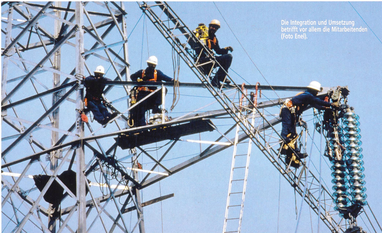
Die Integration und Umsetzung betrifft vor allem die Mitarbeitenden.

hervorzuheben und ihre spezifische Stellung zwischen Markt und Staat zu betonen. Der nötige Konsens bei Zusammenschlüssen ist nur über eine Einsicht in die Hintergründe dieser Massnahme zu erreichen. Ansonsten ist mit Opposition unter anderem der Bevölkerung zu rechnen, wie das Volks-Nein zur Privatisierung der Elektrizitätswerke des Kantons Zürich (EKZ) im Jahr 2001 gezeigt hat. Bei der Überzeugungsarbeit ist eine Kommunikationsoffensive bei ausgewählten Anspruchsgruppen (Mitarbeitende, Öffentlichkeit, politischen Parteien, Medien, Personalverbänden usw.) hilfreich, welche auf den Erkenntnissen aus dem Stakeholdermanagement basiert.