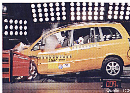
Der Gas-betriebene Opel Zafira ist bei einem Unfall ebenso sicher wie ein konventionelles Fahrzeug, das mit Benzin oder Diesel betrieben wird.

Das Gassystem blieb auch nach dem Aufprall mit 64 Stundenkilometern dicht. Die vier am Fahrzeugboden angebrachten Gasflaschen wurden durch den robusten Metallkäfig geschützt. Auch das Leitungssystem im direkten Crashbereich blieb unbeschädigt. Alle Leitungen sind so flexibel konstruiert, dass sie bei einer Kollision zerstörungsfrei verbogen werden und dicht bleiben. Zudem sper-