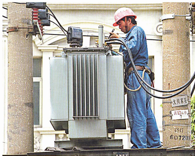
Montage eines Transformators in Shanghai.

(d) Die Stromerzeuger in China können nach Behördenangaben mit dem wachsenden Bedarf der Wirtschaft des Landes kaum Schritt halten. Der Elektrizitätsbedarf werde 2005 um weitere 12% zunehmen nach einem Anstieg von 14,8% im Jahr 2004.