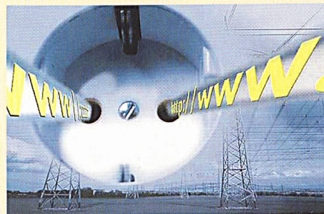
Stromleitungen zum Aufbau alternativer Breitbandzugänge.

Durch die EU-weite Liberalisierung der Energiemärkte erhalten die Stromversorgungsunternehmen neue Möglichkeiten, um ihre vorhandenen Versorgungsnetze und Stromleitungen zum Aufbau alternativer Breitbandzugänge zu nutzen. In vielen Fällen stellte die Unsicherheit hinsichtlich der Regeln für diesen Markt eine Markteintrittsbarriere dar. Um für klare Regelungen zu sorgen, hat die Kommission diese Empfehlung und die entsprechenden Durchführungsbestimmungen zuvor ausführlich mit den EU-Mitgliedstaaten erörtert. Nach der Kommissionsempfehlung sollen die Mitgliedstaaten alle ungerechtfertigten rechtlichen Hindernisse beseitigen, die insbesondere die Energieversorgungsunternehmen vom Aufbau solcher Breitbandkommunikationssysteme über Stromleitungen abhalten.