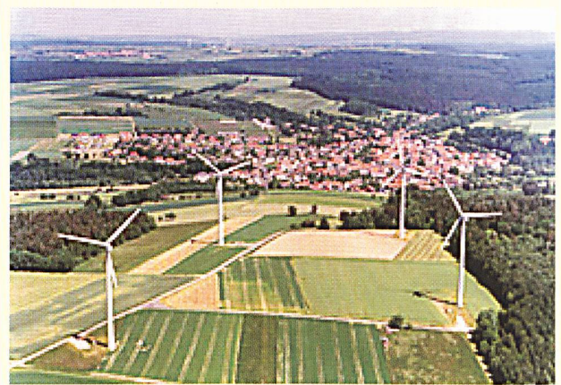
Zu viel Geld für Windenergie?

Der Bürger bezahle auf verschiedensten Wegen für den Klimaschutz. Er habe ein Recht darauf, dass dieses Geld möglichst effizient eingesetzt werde, das heisst, dass er pro eingesetzten Euro möglichst viel Klimaschutz bekomme. Allein die Kosten für die Förderung der Windenergie betragen derzeit 2,4 Milliarden Euro pro Jahr – mit steigender Tendenz. Damit würden sie in absehbarer Zeit die Subventionen für die Kohleförderung übertreffen, so der deutsche Branchenverband VDEW.