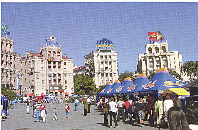
Steigender Strombedarf in der Ukraine (Kiew).

(a) Die Ukraine beabsichtigt, zusätzlich zu den zwei bereits geplanten Kernreaktoren elf weitere zu bauen. Dies solle bis zum Jahr 2030 geschehen, teilte die staatliche Atombehörde in Kiew mit. Von den 15 Reaktoren, die derzeit in Betrieb seien, könnten die ältesten nur noch bis zum Jahr 2011 genutzt werden. Die beiden Reaktoren, deren Bau bereits im vergangenen Jahr angekündigt worden war, sollten auf dem Gelände des Kernkraftwerks Chmelnyzki im Westen des Landes entstehen. In der Ukraine stammt fast die Hälfte des erzeugten Stroms aus der Atomkraft.