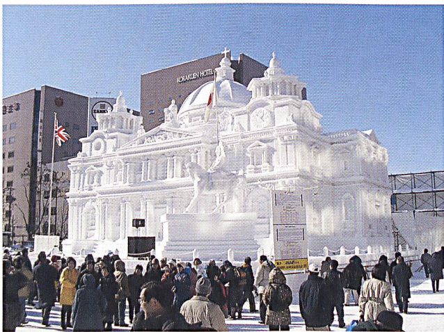
Gipfel der Elektrizitätswirtschaft diskutierte Klimapolitik (Schneefestival in Sapporo).

(ef) Die Schweizer Gewerkschaften zeigen sich nach dem Entscheid des Nationalrates für eine etappierte Marktöffnung nicht kompromissbereit. Sie fordern, dass der Ständerat das vom Bundesrat vorgeschlagene zweite Referendum vor dem Übergang zur zweiten Etappe wieder einfügt. Der VPOD habe an seiner Delegiertenversammlung eine Resolution verabschiedet und darin seine grundsätzliche Ablehnung der Marktöffnung bekräftigt. Der Gewerkschaftsbund sieht in dieser Resolution seine Zustimmung zum Expertenkommiss allerding nicht gefährdet.