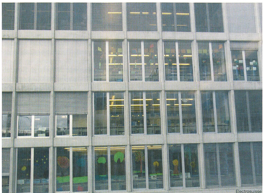
Bild 1 Schulhaus Birch: Auch bei diffusem Tageslicht sind 500 Lux schnell erreicht – die Beleuchtungsreihe am Fenster schaltet dementsprechend früh aus.

«Die Hersteller machen grosse Versprechen, eine saubere Regelung ist aber eine Utopie – es gibt schlicht zu viele Fehlerquellen», meint Serge Hauser 1) , Bereichsleiter eines renommierten Planungs- und Ingenieurbüros für Gebäudeinstallationen, zur tageslichtgesteuerten Beleuchtung. Das Problem liege bei der Erfassung der Helligkeit im Raum. Der Sensor messe nur in einem Punkt des Raumes. Wenn dort ein dunkles Möbel stehe, werfe es die Tageslichtmessung durcheinander. Mehrere Sensoren seien zu teuer und würden vom Architekten kaum akzeptiert, denn diese müssen gut sichtbar an der Decke platziert werden. Eine weitere Möglichkeit sei ein zentraler Sensor auf dem Dach des Gebäudes. Je nach Tageszeit und Lage wird daraus die Helligkeit in den einzelnen Räumen berechnet. Doch auch hier sei die Ungenauigkeit je nach Möblierung, Stellung der Storen oder dem Schatten anderer Gebäude gross.