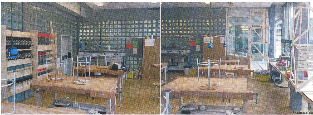
Bild 2 Tageslicht (rechts) und künstliches Licht (links) wirken anders auf den Benutzer. Zudem muss der Schattenwurf beim Tageslicht beachtet werden – zum Beispiel bei Arbeiten mit dem Rücken zum Fenster.

Hauser ist es wichtig, dass der Mensch entscheiden kann, wann er Licht will und wie viel. Das System soll ihn nur überwachen, also zum Beispiel das Licht ausschalten, wenn er nicht anwesend ist. Denn ganz ohne Steuerung gehe es nicht, wenn das Gebäude den Minergie-Standard SIA 380/4 einhalten soll. Wenn die Beleuchtung aber automatisch auf einen bestimmten Wert geregelt werde, seien die Nutzer, etwa Ärzte in Spitälern, häufig unzufrieden.