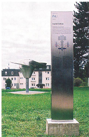
Ausgediente, neu verkleidete Kaplan turbine im Park (Foto: N. Wollinsky, FHU).

(idw) Das fünfte Exponat des Energieparks auf dem Campus der Fachhochschule Ulm (FHU) – das Laufrad einer Kaplan turbine – ist fertig gestellt. In Gegenwart des Stifters Eon Energie wurde es seiner offiziellen Bestimmung übergeben: als Anschauungsobjekt für Studierende des Maschinenbaus und Attraktion für Besucher. Der FHU-Campus ist damit der einzige in Deutschland, der die drei wichtigsten Typen von Wasserturbinen präsentiert.