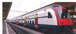
«Weichen für die Zukunft»: neuer ZVV-Doppelstock-Triebzug (Nennleistung: 3,2 MW).

(si) SBB, der Zürcher Verkehrsverbund (ZVV) und Siemens Schweiz präsentierten am 2. Dezember die erste Komposition des neuen Doppelstock-Triebzuges. Das neue Rollmaterial steigert den Komfort für die Bahnreisenden und ermöglicht einen Kapazitätsausbau auf dem S-Bahn-Netz. Die SBB investiert 447 Millionen Franken in die 35 modernen Doppelstock-Triebzüge, die bis 2008 ausgeliefert werden.