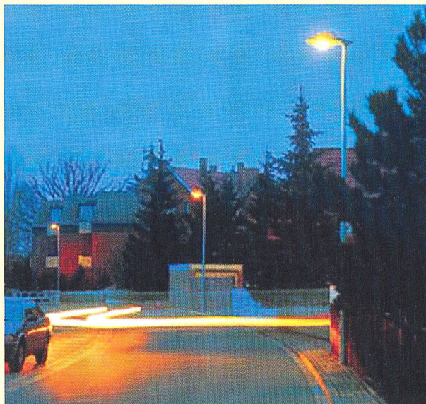
Strassenbeleuchtung in Gelb (Foto FGL).

(fgl) Immer mehr innerstädtische Strassen sind in gelbes Licht getaucht. Das liegt nicht etwa daran, dass die Planer etwas Farbe in das Stadtbild bringen möchten. Nein, gelbes Licht – so die Fördergemeinschaft Gutes Licht (FGL, Frankfurt) – kombiniert Verkehrssicherheit und Energieeinsparung.