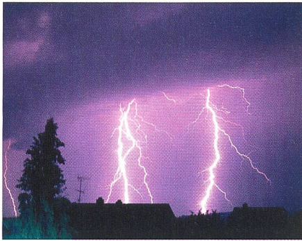
Vor dem Blitz die Gewitterwolken anzapfen?

Elektrizität nicht aus Blitzen erzeugt werden muss. Bevor sich die Energie von Gewitterwolken in Blitzen entlädt, formen sich zwischen dem Erdboden und den Wolken während mehreren Minuten elektromagnetisch geladene Felder. Kolumbianischen Forschern soll es nun gelungen sein, diese Energie aufzufangen und zu speichern. Das System scheint einfach zu sein. Auf dem Erdboden werden Apparate installiert, die in ihrer Oberfläche an einen Kaktus erinnern. Über die «Stacheln» wird die Energie, die sich zwischen den negativ geladenen Gewitterwolken sowie den positiv geladenen Stellen der Erdoberfläche formiert, aufgefangen und in Akkus gespeichert. Die Forscher haben dafür einen südamerikanischen Wissenschaftspreis gewonnen und das Prinzip bereits international patentiert.