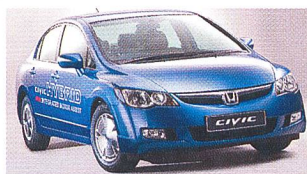
Honda Civic.

Leitfaden für die Vergütung von Strom aus Wasserkraft, Bundesumweltministerium, Postfach 30 03 61, D-53183 Bonn, Telefon: 00491888/305-3355, E-Mail: bmu@broschuerenversand.de , oder kostenlos als PDF von der Homepage: www.bmu.de