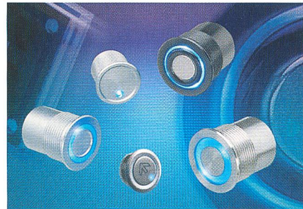
Jetzt auch mit blauer Beleuchtung: vandalensichere Taster von Schurter

Schurter bietet die vandalengeschützten Taster mit Hub- und Piezotaster jetzt auch in Kombination mit blauer Beleuchtung an. Für Geräte mit Nachtdesign wird die Betätigungsfläche durch die Beleuchtung optisch gekennzeichnet. Diese kann auch zur optischen Rückmeldung oder zum Anzei-