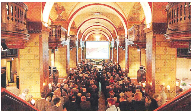
Traditioneller Apéro des Bundesamtes für Energie im Kornhauskeller.