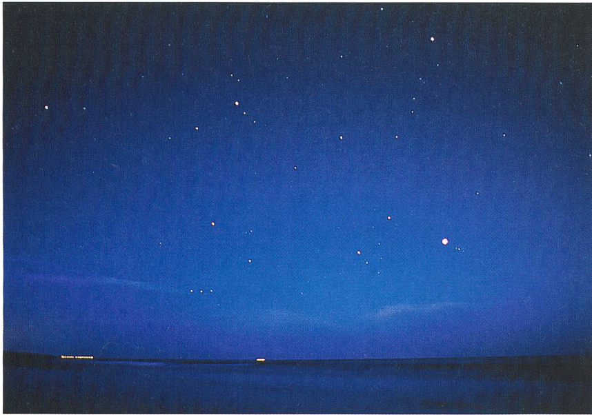
Verschwimmt der sichtbare Sternenhimmel?

zu sensibilisieren. Die in dieser Publikation gemachten Empfehlungen folgen einem einfachen Prinzip: Licht soll nur dorthin gelangen, wo es der Mensch auch braucht. Licht in Richtung Himmel oder in ökologisch sensible Lebensräume zu strahlen, nützt niemandem, sondern verbraucht unnötig Energie, schadet anderen Lebewesen und entwertet das Landschaftserleben. Dies bedeutet: