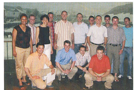
Diplomübergabe der SIU in Luzern 2005