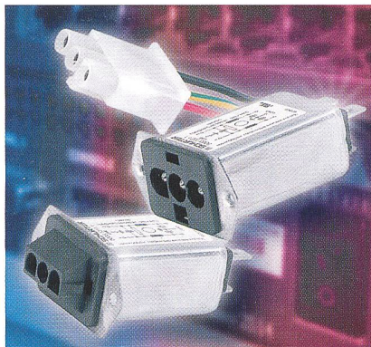
Die DC-Gerätestecker filtern Störungen im Bereich 100 kHz bis 30 MHz.

Die Serie beinhaltet einstufige Netzfilter für Nennströme von 3, 6, 10 und 15 A bei 125 V DC , die eine breitbandige Dämpfung im Frequenzbereich von 100 kHz bis 30 MHz aufweisen. Der Metallflansch kontaktiert das Gerätegehäuse breitflächig (Abschirmung), wobei die Bohrungen mit oder