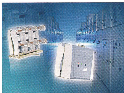
Der Vakuumleistungsschalter Sion ist ausgelegt für alle gängigen Mittelspannungsschaltanlagen von 7,2 kV bis 24 kV Nennspannung.

Der Vakuumleistungsschalter erfüllt sämtliche Anforderungen für den Einsatz in Energieverteilungsanlagen und wurde sowohl an die Bedürfnisse von Energieversorgungsunternehmen als auch an die der Industrie angepasst. Mit Hilfe verschiedener Einbaupakete, wie Einschub, Kontaktarme, Durchführungen und Shuttern, kann der Schalter modular aufgebaut werden. Die Bautiefen betragen 370 mm bei 7,2 kV bis 17,5 kV und 420 mm bei 24 kV. Die Niederspannungsschnittstelle kann separat geöffnet werden und ist leicht zugänglich. Damit können Arbeiten am Sekundäranschluss zeitsparend und bequem vorgenommen werden. Der Vakuumschalter arbeitet mit bis zu 10 000 Schaltungen wartungsfrei. Seine mechanische Gesamtnutzungsdauer gibt Siemens mit bis zu 30 000 Schaltungen an. Er erfüllt die Anforderun-