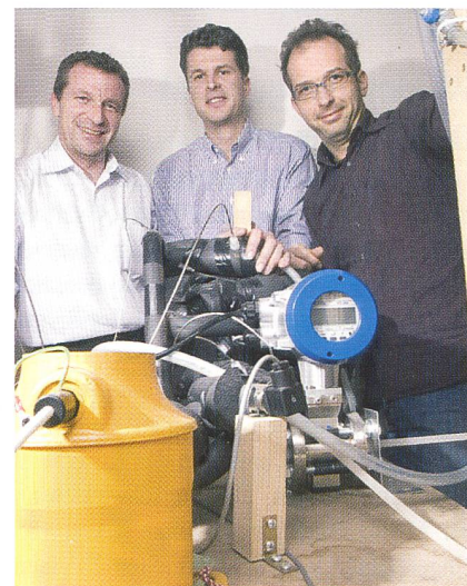
L'équipe du projet de la maison Awtec avec le modèle de fonctionnement de la pompe à chaleur au CO 2 (Gian Vaitl)

Avec le soutien financier de l'Office fédéral de l'énergie et du Service d'électricité de la Ville de Zurich, l'entreprise Awtec, en collaboration avec Stiebel Eltron, a développé un prototype de pompe à chaleur au CO 2 . Le 16 janvier, ce projet s'est vu décerner le Swiss Technology Award 2006 et le prix spécial de la Fondation pour la nature et l'environnement. Les pompes à chaleur au CO 2 conviennent en particulier aux systèmes de chauffage à haute température de l'aller, tels qu'on en trouve dans les anciens bâtiments ou pour le chauffage de l'eau sanitaire. Ce prototype a été soumis à un examen de type dans le fameux Centre de test des pompes à chaleur de la Haute école d'ingénieurs à Buchs. (Sz) – Source: www.awtec.ch