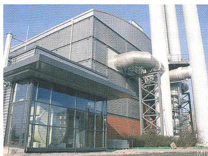
Die Brennstoffzelle, im Innern als Metallzylinder erkennbar, liefert 245 kW elektrische und 170 kW thermische Energie.

Die Schmelzkarbonat-Brennstoffzelle (MCFC) besteht aus einem zylindrischen Stahlbehälter mit einem horizontal ange-