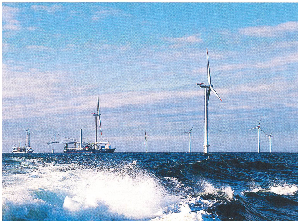
Offshore-Windpark in Bau.