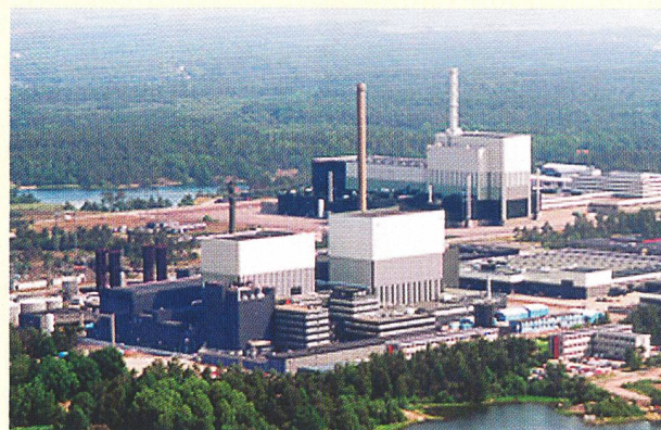
Centrale nucléaire d'Oskarshamn.

L'arrêt anticipé de la centrale nucléaire suédoise de Barsebäck 2 en mai dernier, arrêt motivé par des considérations politiques, coûte aux contribuables suédois l'équivalent de 900 millions de francs. Selon un accord conclu le 10 novembre 2005, cette somme devra être versée aux exploitants comme indemnisation.