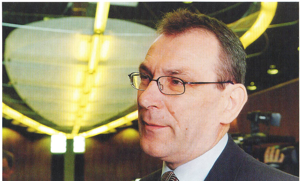
Energiekommissar Andris Piebalgs: «nicht nur formell, sondern auch inhaltlich umsetzen.»