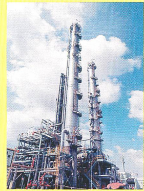
Elektrizität ist sowohl im Industrie- als auch im Dienstleistungssektor der wichtigste Energieträger (Bild Voit).