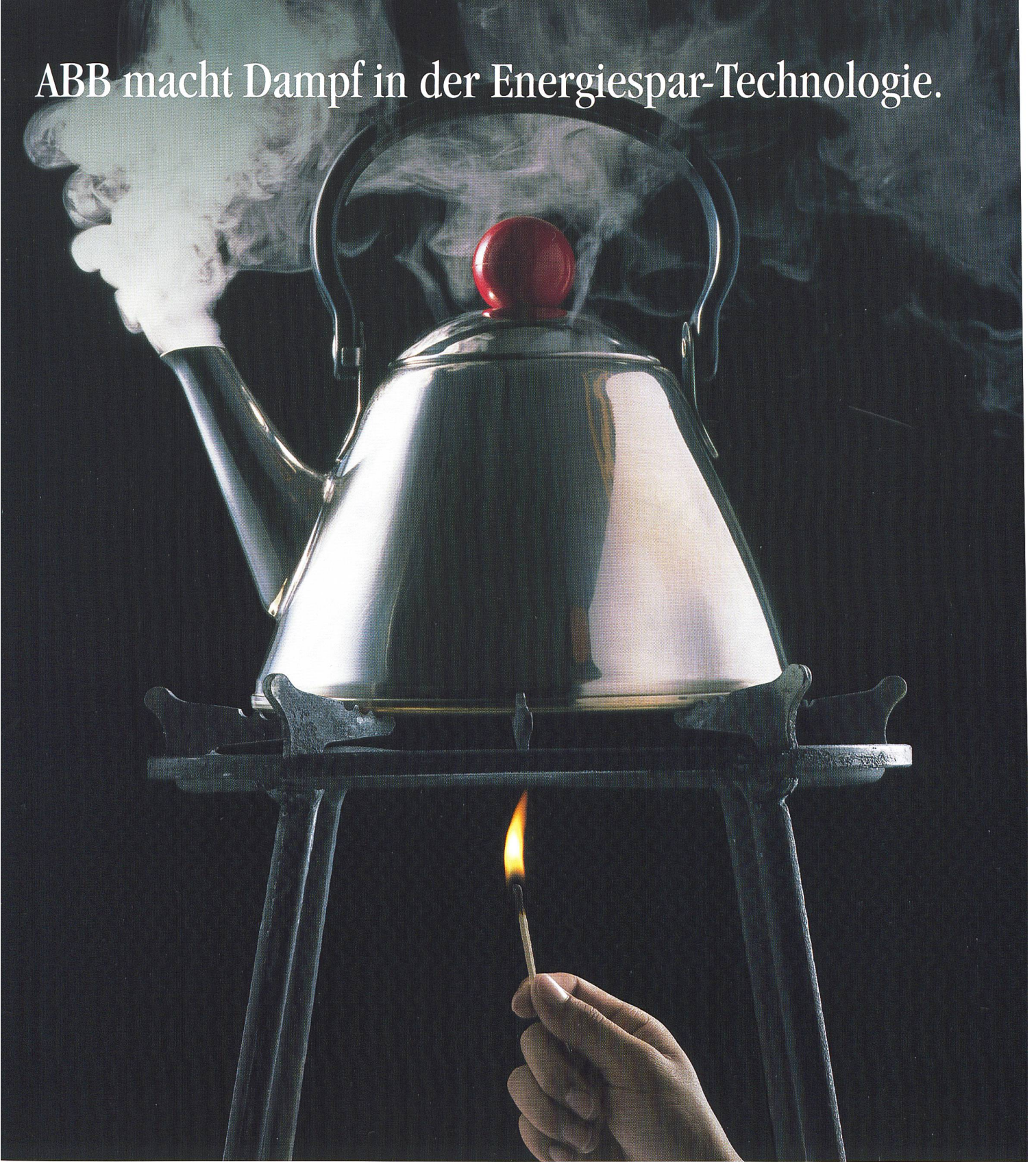
ABB macht Dampf in der Energiespar-Technologie.

Höhere Effizienz im Umgang mit Ressourcen bei gleichzeitiger Produktivitätssteigerung – ABB ist in der Schweiz auf diesem Weg mit weltweit führenden energiesparenden Lösungen dabei. Erfahren Sie mehr über ABB und ihre Energie- und Automatisierungstechnologien unter www.abb.ch