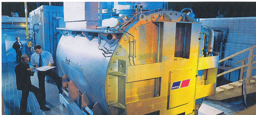
HotModule (mit bis zu 245 kW el und 170 kW th ) von MTU CFC Solutions.

Über die reine Kraftwerksfunktion hinaus geht Honda (Japan) mit seiner 2003 erstmals vorgestellten «Heimenergiestation», die gemeinsam mit Plug Power entwickelt wurde. Der dabei aus Erdgas gewonnene Wasserstoff versorge nach Angaben des Unternehmens zum einen auf Basis einer PEM-Brennstoffzelle einen Haushalt mit Strom und Warmwasser, zum anderen könnten damit direkt an der Station Wasserstofffahrzeuge betankt werden. Mit der nun vorliegenden dritten Generation sei die Leistungsfähigkeit erheblich gesteigert worden, bei deutlich geringeren Abmessungen. Auch die Startzeit der Heimenergiestation habe weiter abgenommen, sie sei nun bereits nach einer Minute funktionsbereit. Durch den gespeicherten Wasserstoff könne die Station zudem bei Energieausfällen mit 5 kW Leistung als Notgenerator dienen. Das weitere Geschehen bei Brennstoffzellen-Kraftwerken bleibt spannend.