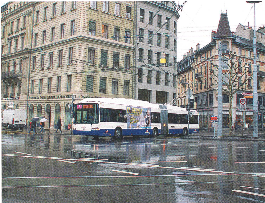
Ausser den zehn LighTram3 verkehren in Genf auch 38 SwissTrolley3.

38 SwissTrolley3 aus der gleichen Produktfamilie. Heute gehören die 48 neuen Fahrzeuge zum Stadtbild. Betriebsleiter