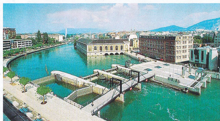
30 Prozent der Produktion aus werkseigenen Flusskraftwerken in der Rhone.