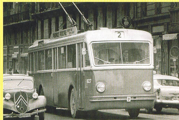
Pioniere: Seit 1942 werden in Genf Trolleybusse mit Alu-Karosserien von Hess eingesetzt (Trolleybus Saurer 1950).

(bw) Die Geschichte des öffentlichen Verkehrs beginnt in Genf am 19. Juni 1862 mit der Eröffnung einer Pferdebahn zwischen dem Place Neuve und Carouge. Im Jahr 1889 folgte eine Dampfstrassenbahn und im Jahr 1894 eine elektrische Strassenbahn. Im Jahre 1899 wird schliesslich die CGTE, die Compagnie Genevoise des Tramways Electriques, die Vorgängergesellschaft der TPG, gegründet. Bis 1923 wurden insgesamt 120 Streckenkilometer gebaut, welche ins Umland und teilweise bis nach Frankreich reichten. Ab 1925 begann man die Tramstrecken auf den Bus umzustellen. Der erste Trolleybus fuhr am 11.9.1942 auf der heutigen Linie 3. Bis zum Jahr 1977 schrumpfte das Tramnetz bis auf die Linie 12 zusammen. Die Renaissance des Trams begann 1995 mit der Eröffnung der Linie 13. Auch das Trolleybusnetz wurde mit der Verlängerung der Linie 3 nach Gardiol, automatischen Weichensteuerungen, 38 neuen Swisstrolley3 und 10 LighTram3 in den Jahren 2004 bis 2006 den heutigen Bedürfnissen angepasst. Heute bedienen 4 Tram-, 6 Trolleybus- und 45 Autolinien eine Agglomeration mit 425 000 Einwohnern. Das Team der TPG besteht aus 1436 Mitarbeitern (2004); auf dem 375 km langen Netz werden mit insgesamt 366 Fahrzeugen jährlich 17,5 Mio. km zurückgelegt und 117,8 Mio. Fahrgäste befördert. www.tpg.ch