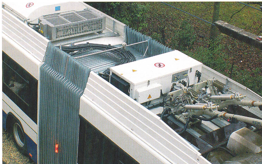
Klarer Verlegungsplan: Die Fahrzeugelektrik auf dem Dach.