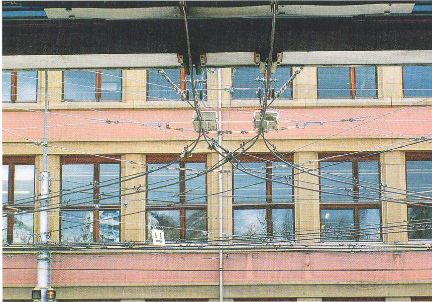
Weichenanzeigen: Liegen gut im Gesichtsfeld des Chauffeurs.