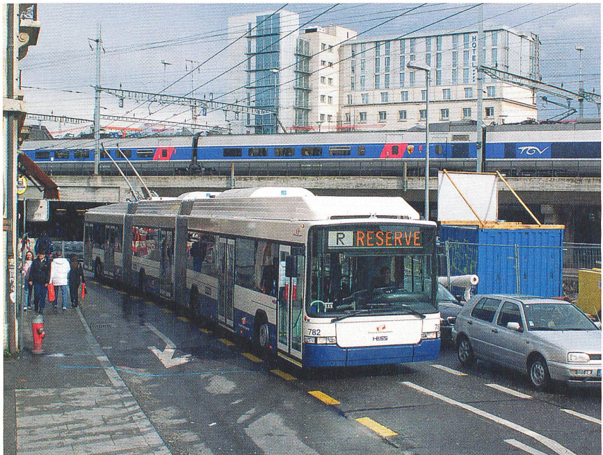
In Genf können alle Haltestellen ohne Umbauten angefahren werden.