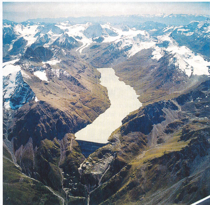
Umweltfreundliche Wasserkraft für Genf: Die Staumauer Grand Dixence im Wallis.