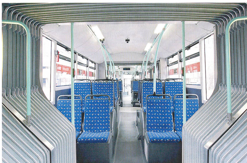
Im LighTram3 der TPG gibt es 66 Sitz- und 126 Stehplätze.

ter fahren kann, ärgert die Fahrgäste am meisten», betonen die angesprochenen ÖV-Experten mit Übereinstimmung. Im Gespräch mit Markus Quaile, Geschäftsführer bei FBT in Thörigen, erfahren wir mehr über die Qualität der Schweizer Türen: «Mit ihrem elektrischen Antrieb kann die Tür präzise gesteuert werden; zudem ist sie gegenüber einer pneumatischen Tür nicht anfällig auf Temperaturschwankungen. «Die Türen haben einen weiteren Vorteil, indem sie ohne Dachausschnitt in die Struktur der Karosserie eingebaut werden können. Die hochwertigen Türen wurden entwickelt, um den jährlich rund 250 000 Zyklen über die ganze Lebensdauer des Fahrzeugs und Temperaturen von bis zu minus 30° Celsius störungsfrei Stand halten zu können.