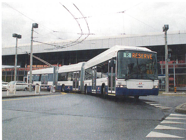
Das LighTram3 beim internationalen Flughafen von Genf.