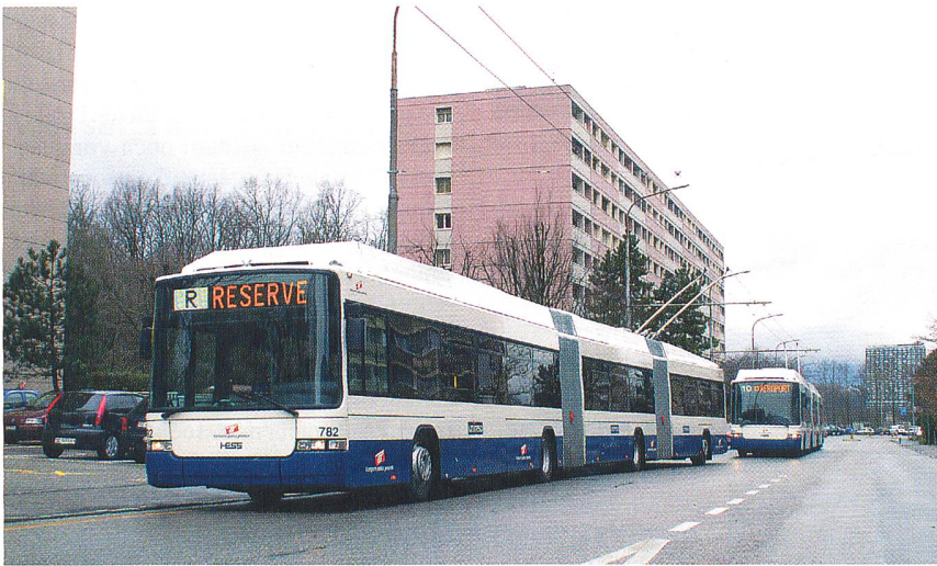
Bei den TPG fahren zehn neue LighTram3

In der Rhonestadt bestand schon seit längerer Zeit Ersatzbedarf bei der Trolleybus-Flotte. Im Jahre 2004 betrug das Durchschnittsalter der total 74 Gelenkfahrzeuge 21 Jahre; der Bestand war zu 90% amortisiert. Im Hinblick auf die Kapazitätserhöhung auf der rund 10 km langen Linie 10 Aéroport–Bel-Air–Onex–Cité setzten die Transports Publics Genevois (TPG) ab Dezember 2003 ein LighTram als Prototypen ein. Der bei Hess zum Doppelgelenk-Fahrzeug umgebaute Trolley war Teil einer 1992 nach Genf gelieferten Serie des Typs SwissTrolley1. Da das Fahrzeug bereits damals mittelhochflurig war, entschieden die Verantwortlichen, einen neuen Mittelteil mit einem über beide Gelenke durchgehenden, stufenlosen Flur. Beim Umbau wurde die zweite Antriebsachse nach vorne in den neuen Mittelteil gelegt. Aufgrund der positiven Bilanz während der knapp dreimonatigen Testphase wurde am 1. März 2004 zwischen den TPG und Hess der Vertrag zur Lieferung von zehn neuen LighTram3 mit Niederflurtechnik unterzeichnet. Ebenso bestellten die TPG